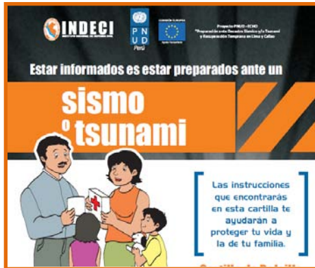
Distribución de Cartilla de Bolsillo

Spots de TV y cuñas radiales sobre Sismos y Combo de la Supervivencia