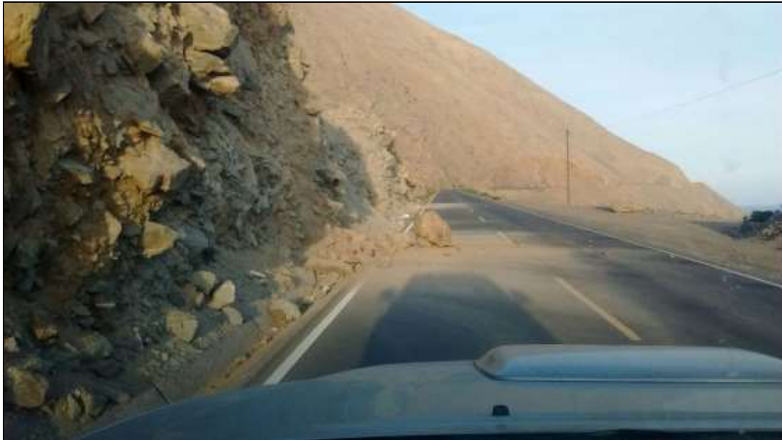
Derrumbe en vía Panamericana Sur