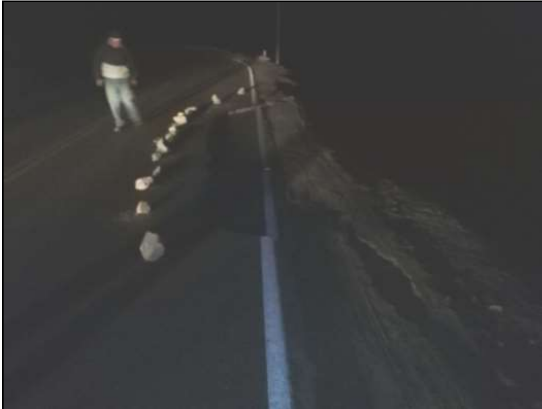
Afectación en km 735 – Panamericana Sur