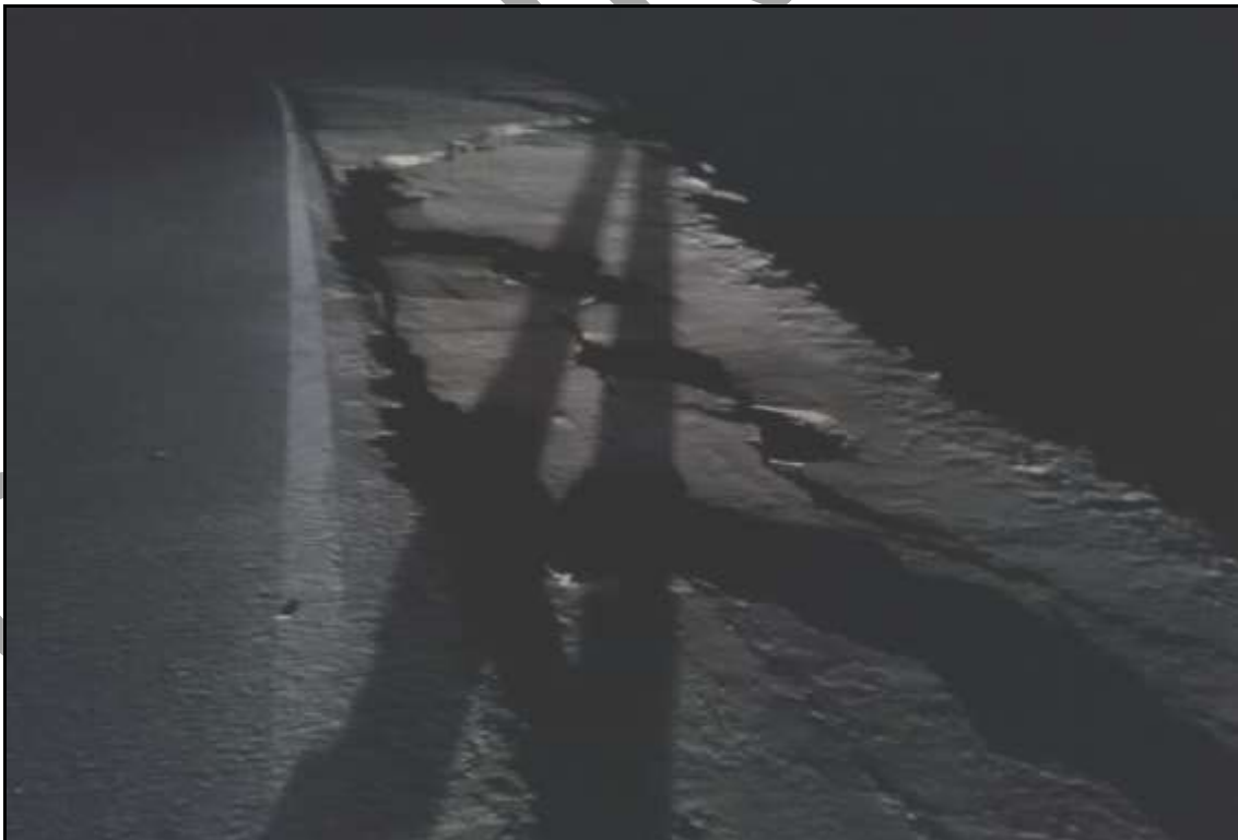
Afectación en km 735 – Panamericana Sur