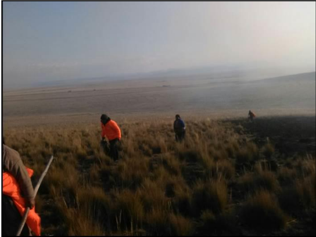
Incendio extinguido en el Centro Poblado de Shelby