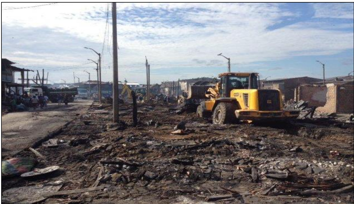
REMOCIÓN DE ESCOMBROS CON MAQUINARIA DEL GORE-LORETO