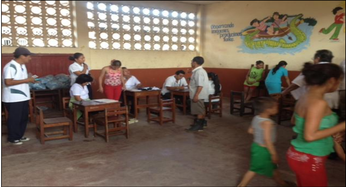
POBLACIÓN RECIBIENDO ATENCIÓN MÉDICA