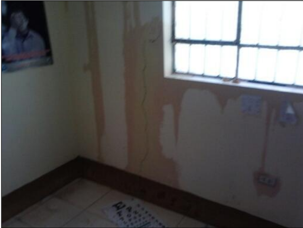
Establecimiento de Salud de Pampamarca inhabitable