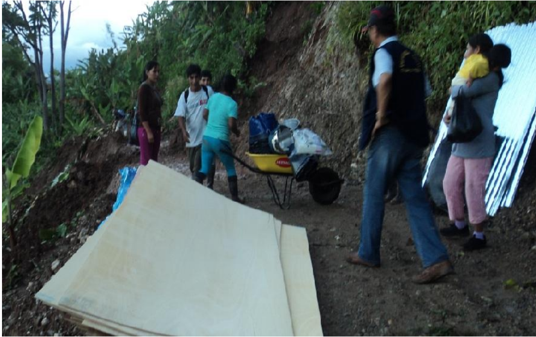
Ayuda humanitaria entregada