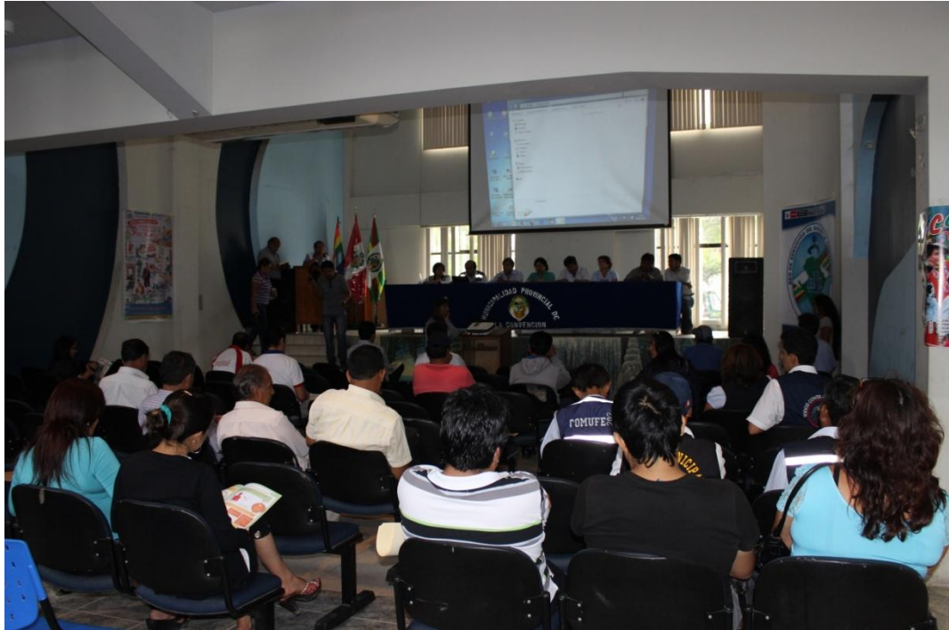
Reunión multisectorial en Palma Real.