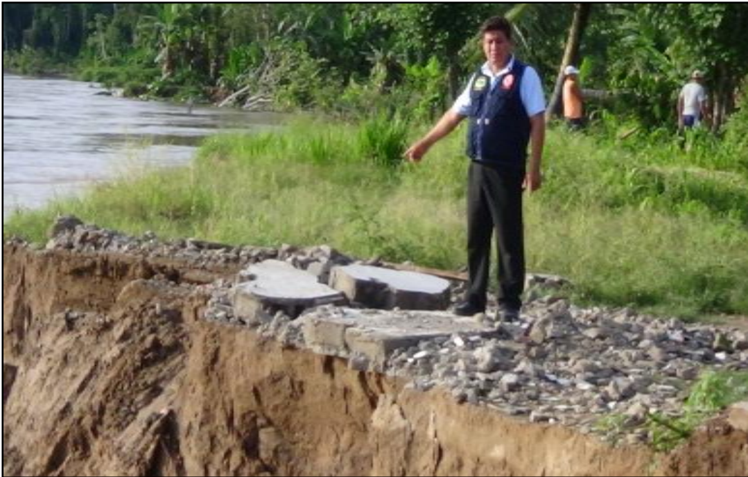
Margen derecho del Río Ucayali, zona del deslizamiento