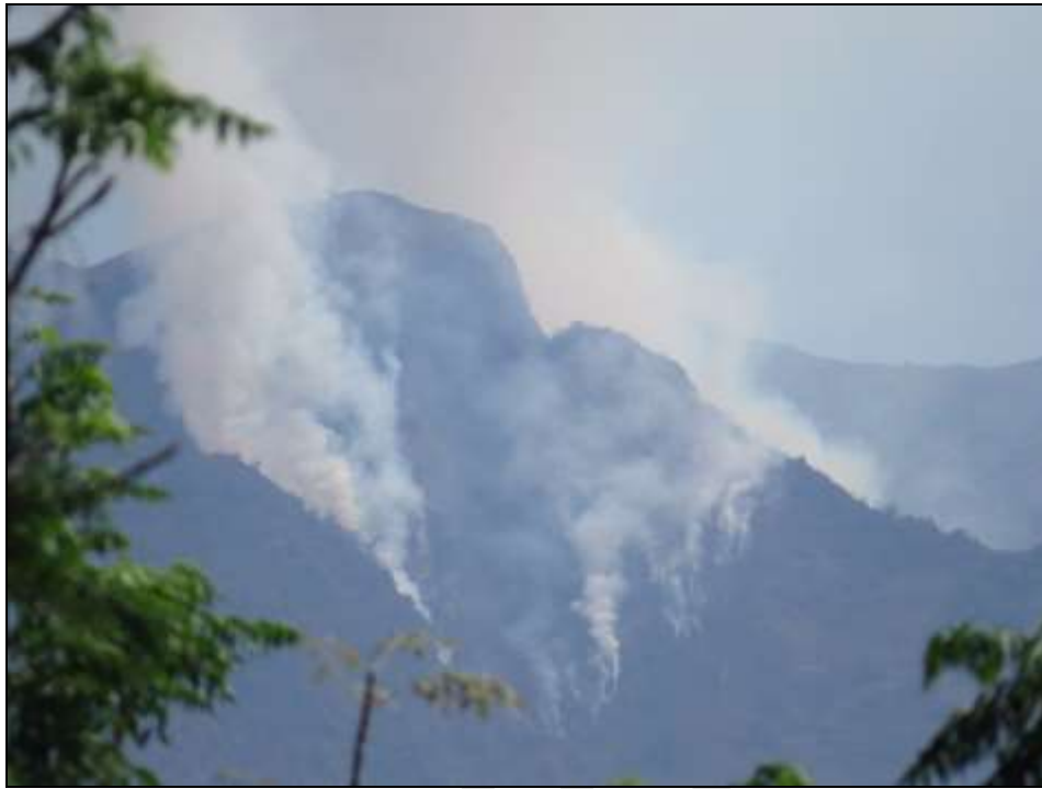
Zona de incendio