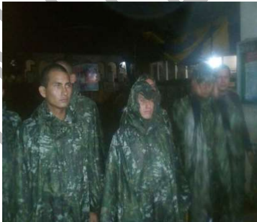
MOVILIZACION DEL EJERCITO PERUANO