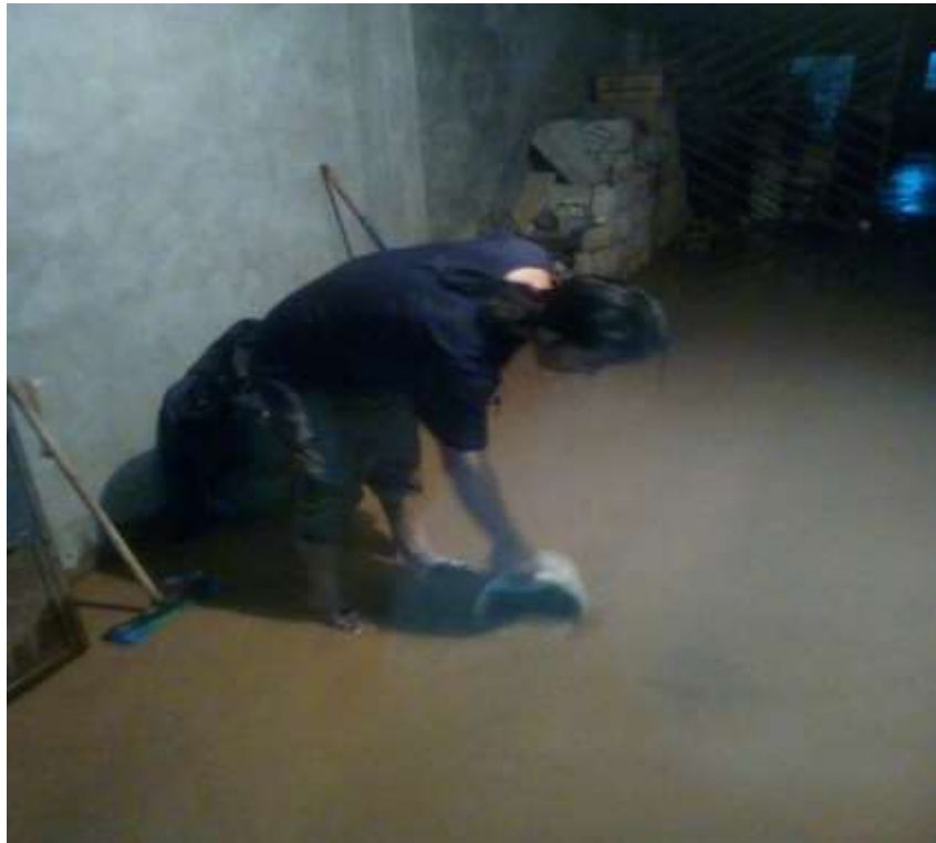
VIVIENDA DEL DISTRITO AMARILIS AFECTADO