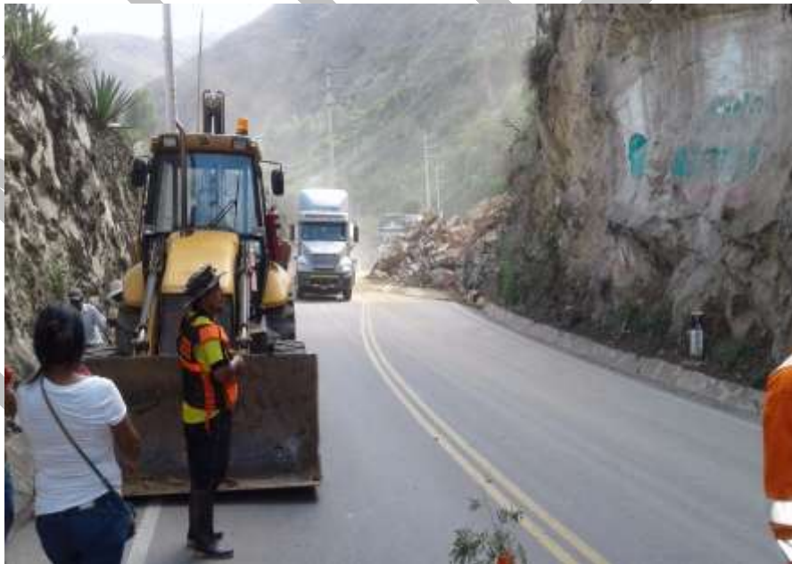
PROVIAS REALIZÓ LA LIMPIEZA DE VÍAS AFECTADAS EN LA LOCALIDAD VICHAYCOTO, DISTRITO DE PILLCO MARCA.