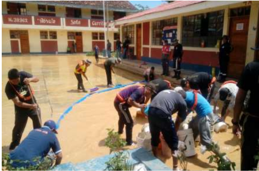
I.E. RÓMULO SOTO DEL SECTOR UNO SAN LUIS REALIZAN LIMPIEZA DE LAS INSTALACIONES