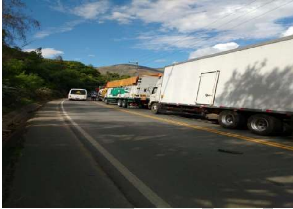
TRANSITO PARCIALMENTE RESTABLECIDO POR UN SOLO CARRIL