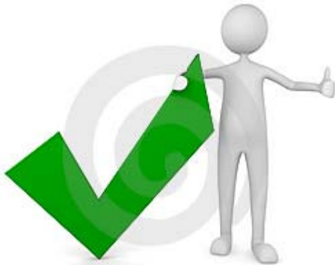
Etapa de Aprobación