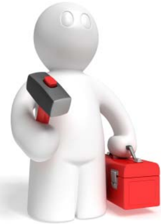
Etapa de Implementación y Ejecución