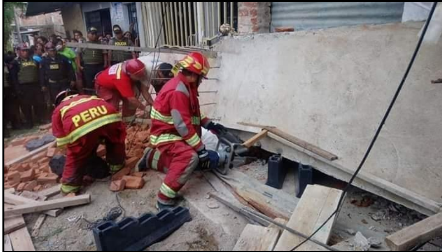
Bloque de concreto

Personal de Compañía de Bomberos N° 066 – Tumbes realiza rescate