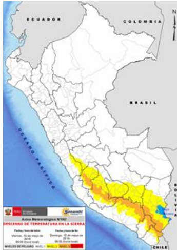
AVISO N°064 SENAMHI