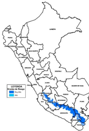
ESCENARIO DE RIESGO NACIONAL