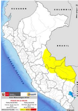
AVISO N°074 SENAMHI