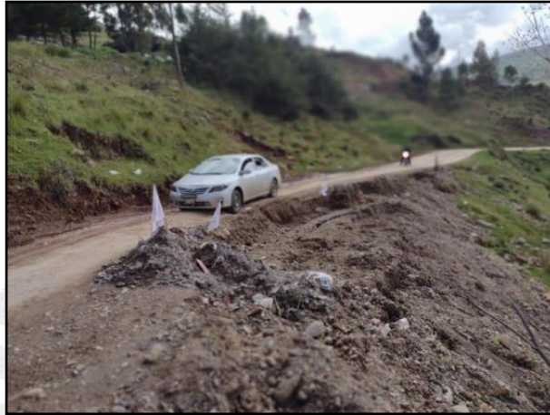
Camino rural rehabilitado