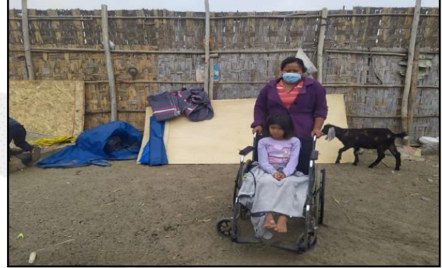
Entrega de Bienes de Ayuda Humanitaria