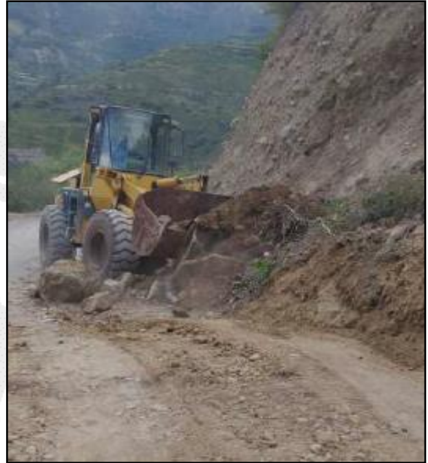
Trabajos de rehabilitación en la vía