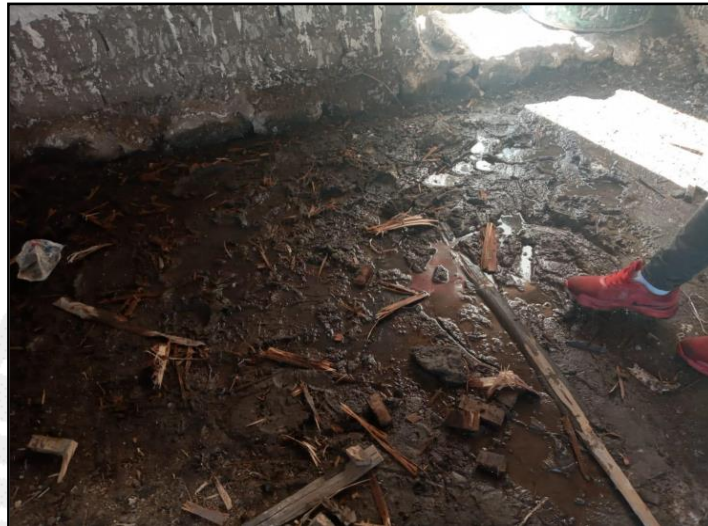
Inundación en el interior de la vivienda