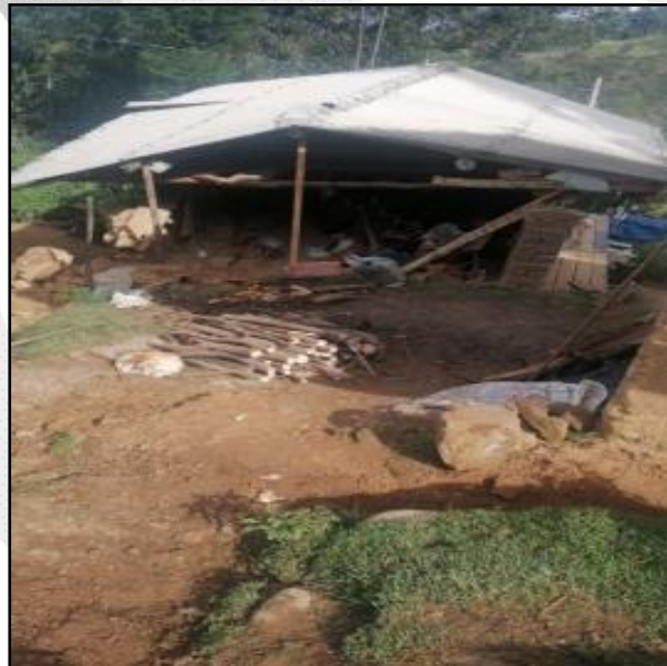
Vivienda inhabitable producto de las lluvias intensas