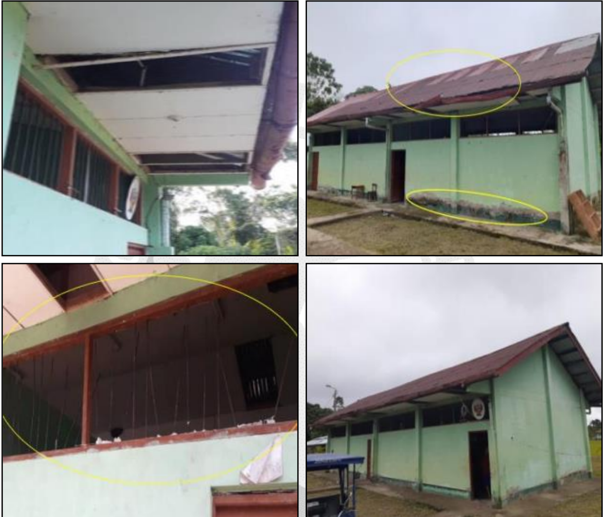
Institución Educativa N° 60705 afectada